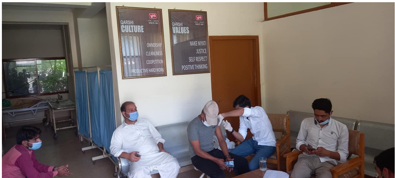
Medical Center, UPR

The University of Poonch Rawalakot (UPR) provides comprehensive medical and health facilities through a fully operational health center on its main campus. A dedicated physician is available to serve students, staff, and the local community. In addition to the health center, Qarshi Health Care Clinic and Hamdard Free Mobile Clinics actively support community healthcare needs. In 2021, the University Health Center treated and examined over 10,000 patients. Regular diabetes screening camps are held monthly in various areas, while Hepatitis B and C screening camps are organized in other locations. Emergency healthcare is bolstered by the university's ambulance service, which ensures intra-campus emergency assistance. Two ambulances are on standby to transport patients referred to secondary or tertiary care facilities. During the COVID-19 pandemic, UPR launched an emergency campaign, conducting screenings and implementing preventative measures. Temperature checks and sanitizers were distributed across all faculties, departments, and administrative offices to ensure safety.