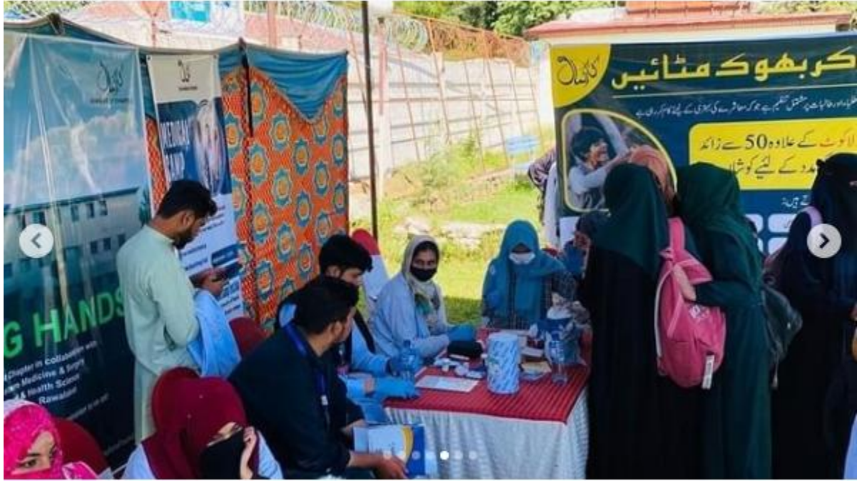
Free Medical Camp for Local community